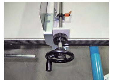
幅だしゲージハンドル